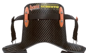
有力F1パイロットも装着するプロ。