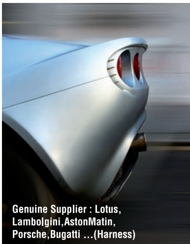
Genuine Supplier : Lotus, Lamborghini, AstonMartin, Porsche, Bugatti ... (Harness)