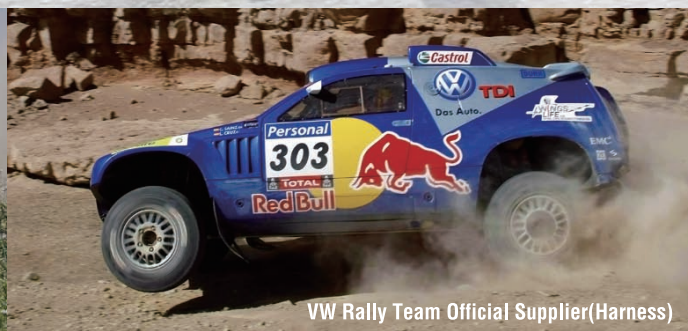
VW Rally Team Official Supplier (Harness)