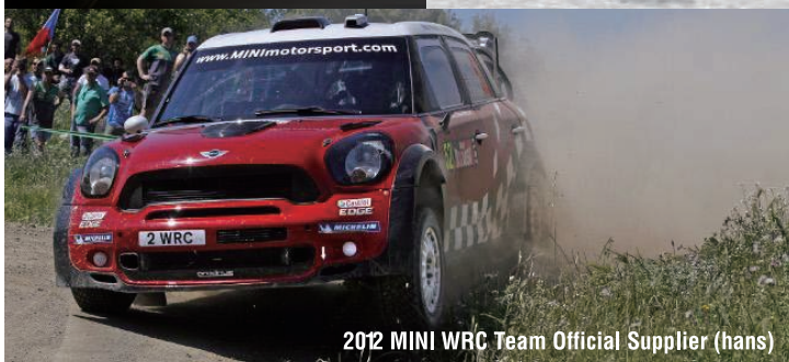
2012 MINI WRC Team Official Supplier (hans)