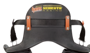
小型・軽量・新形状スポーツII。