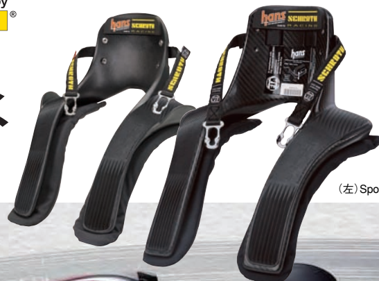
(左) Sport II (右) PRO